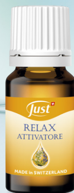
RELAX ATTIVATORE Perfetto bilanciamento di oli essenziali con virtù rilassanti e stimolanti. 10 ml - Art. 6995