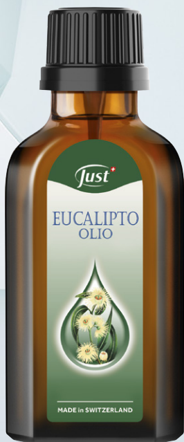
OLIO EUCALIPTO La balsamica miscela di ingredienti vegetali dall'efficacia purificante. 50 ml - Art. 6506

Attraverso l'olfatto e sulla pelle, le miscele, ottenute con sinergie uniche ed esclusive, e le essenze ispirate a singole piante sono alleate del benessere in tantissime situazioni e in ogni stagione.