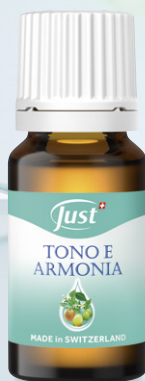
TONO E ARMONIA Note agrumate e dolci per favorire il giusto tono, in modo armonico. 10 ml - Art. 6997